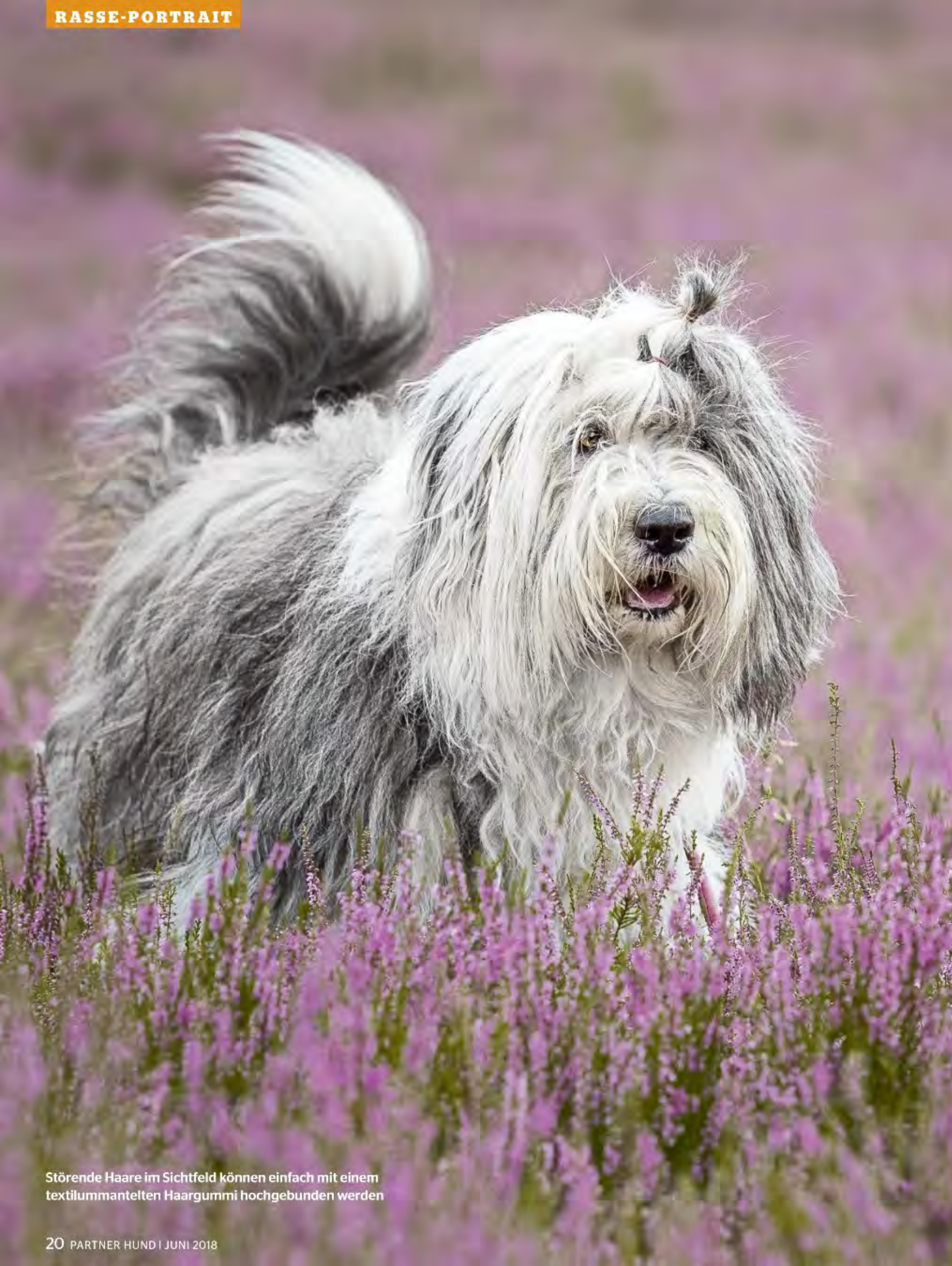
Störende Haare im Sichtfeld können einfach mit einem textilmantelten Haargummi hochgebunden werden