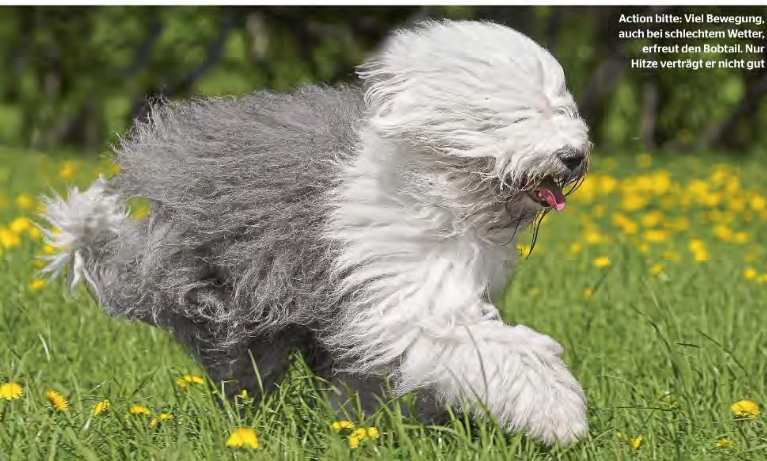
Action bitte: Viel Bewegung, auch bei schlechtem Wetter, erfreut den Bobtail. Nur Hitze verträgt er nicht gut