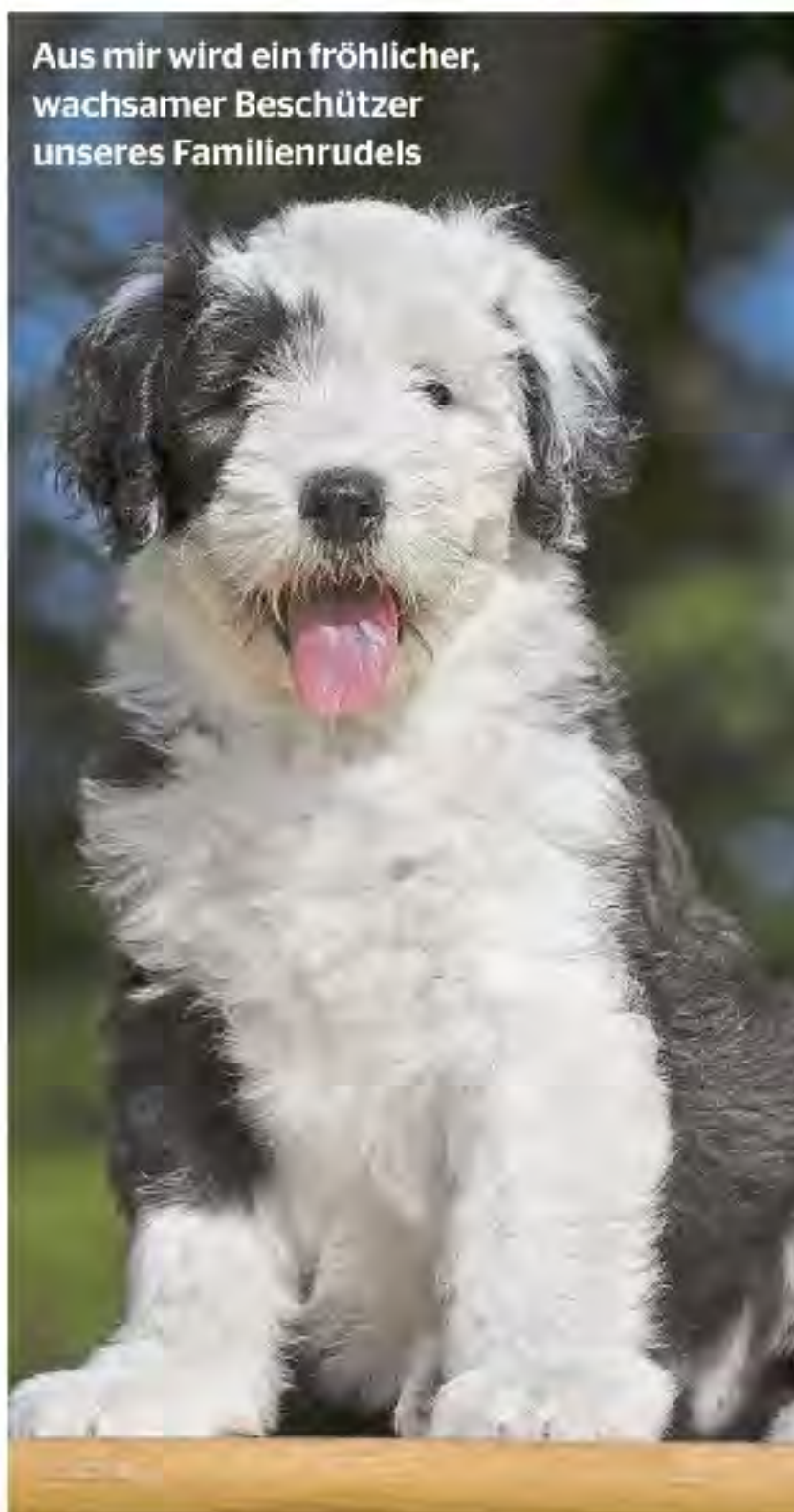
Aus mir wird ein fröhlicher, wachsamer Beschützer unseres Familienrudels

genauso wenig ideale Bobtail-Besitzer, wie jene, die beim Gedanken an schlammige Pfotenabdrücke schon einen Ohnmachtsanfall erleiden. Wen all das nicht stört, der bekommt einen Hund, der von jedem Hundefreund bewundert wird, der sein Familienrudel abgöttisch liebt, immer und überall dabei sein will und auch Kindern und anderen Haustieren gegenüber freundlich gesinnt ist, so er entsprechend geprägt und sozialisiert wurde.