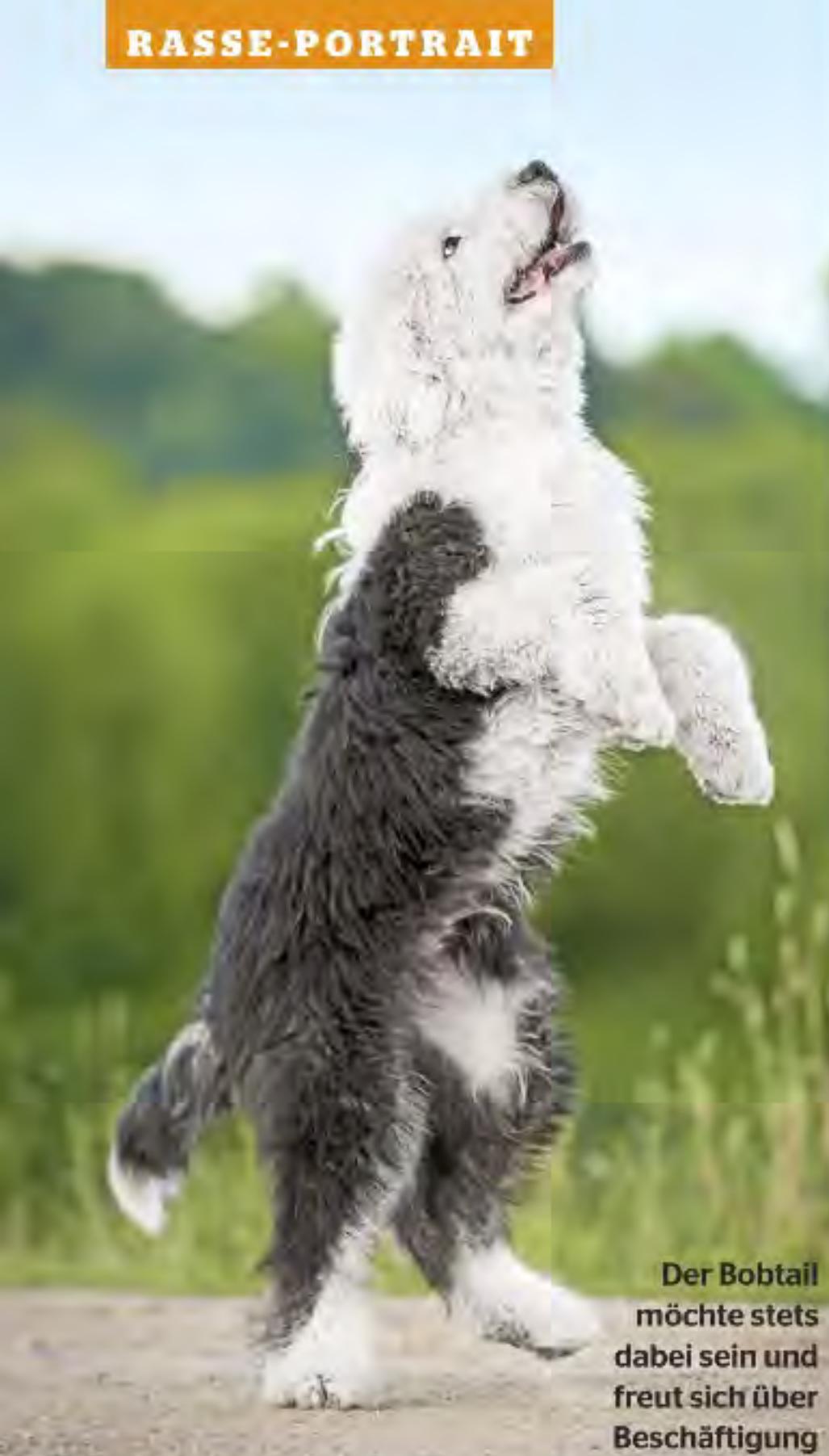
Der Bobtail möchte stets dabei sein und freut sich über Beschäftigung